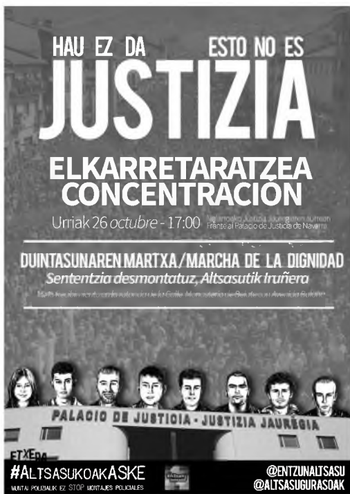
Cartel de la concentración contra la sentencia, en el Palacio de Justicia de Navarra